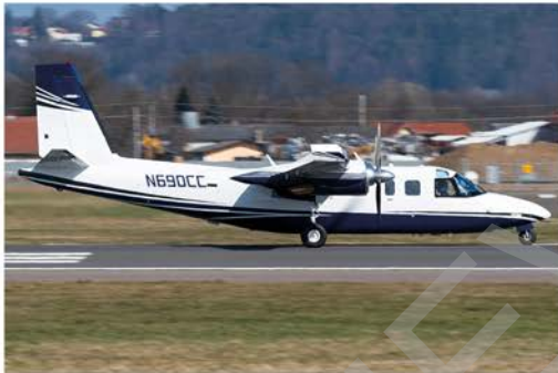
Am 19. März landete aus Magdeburg kommend die TJ Air Holdings Rockwell Aero Commander 690B N690CC am Flughafen Graz.