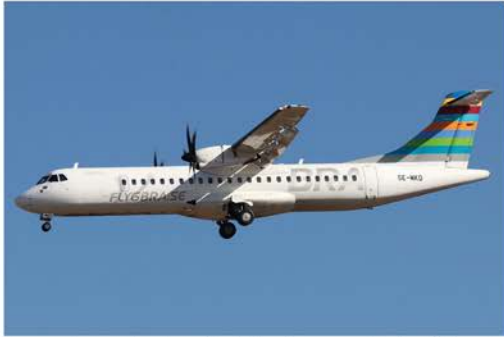
Das schwedische Biathlonteam nützte für die Rückreise am 22. Februar nach Åre Östersund die ATR 72 SE-MKD von Braathens.