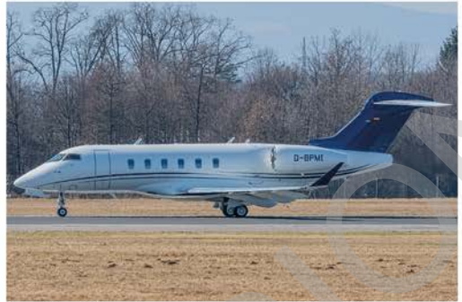
Am 2. März brachte ein Ad-Hoc-Charter die Bombardier Challenger 350 D-BPMI aus Frankfurt-Hahn nach Graz.