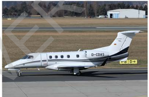
Von Friedrichshafen nach Graz und retour ging es für die DAS Private Jets Embraer Phenom 300 D-CDAS am 19. März.