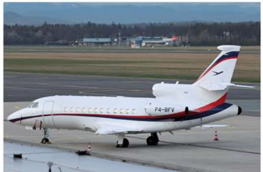
Am 11. März landet die Bestfly Aircraft Dassault Falcon 900 P4-BFV in Graz. Zwei Tage später ging es weiter nach Wien.