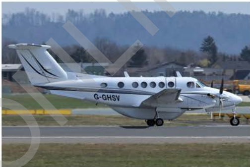
Vom 25. bis inklusive 29. März war die Beechcraft 200 Super King Air G-GHSV der englischen Charterfluggesellschaft LyddAir vor Ort.